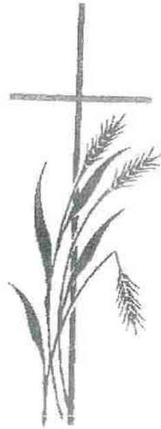
BLOEM 31 + KRUIS