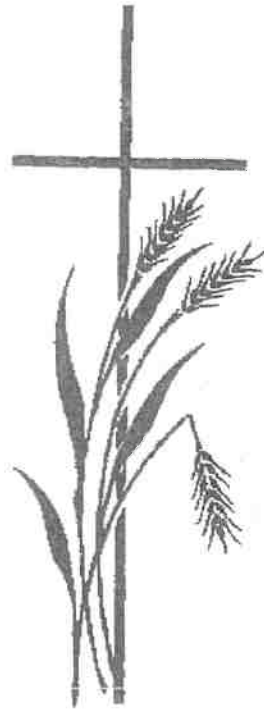
BLOEM 31 + KRUIS