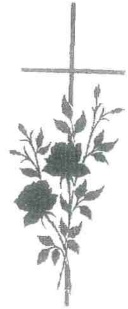
BLOEM 12 + KRUIS