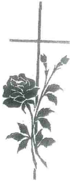
BLOEM 3 + KRUIS