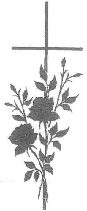
BLOEM 12 + KRUIS