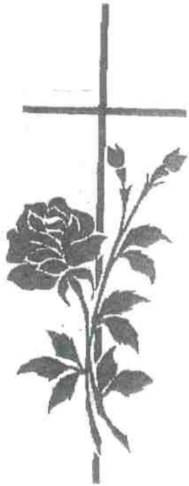
BLOEM 3 + KRUIS.