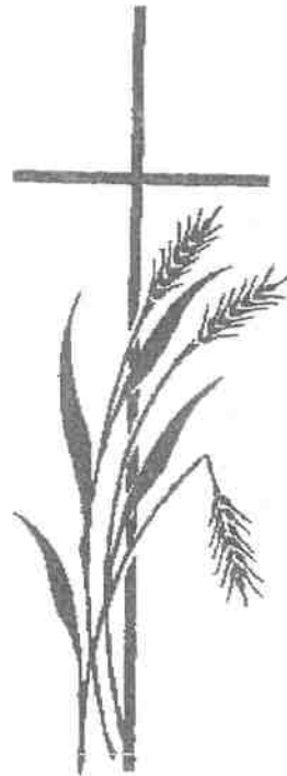
BLOEM 31 + KRUIS