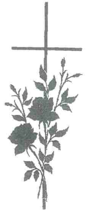
BLOEM 12 + KRUIS