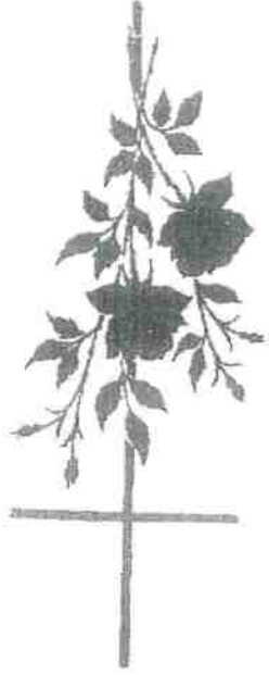
BLOEM 12 + KRUIS