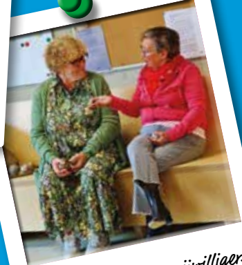
17/10 - Petaque vrijwilligers