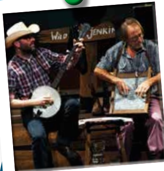
27/10 - Ouheil in Black