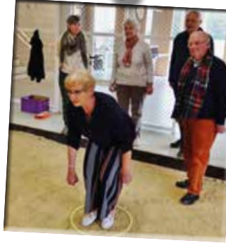
17/10 - Petaque vrijwilligers