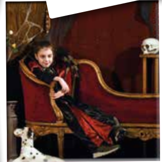
30/10 - Halloween in CC