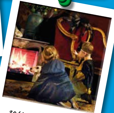
30/10 - Halloween in CC