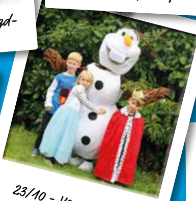
23/10 - Verwendag Bib