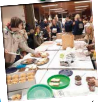
22/10 - Dag van de jeugd- beweging