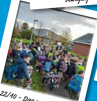
22/10 - Dag van de jeugd- beweging